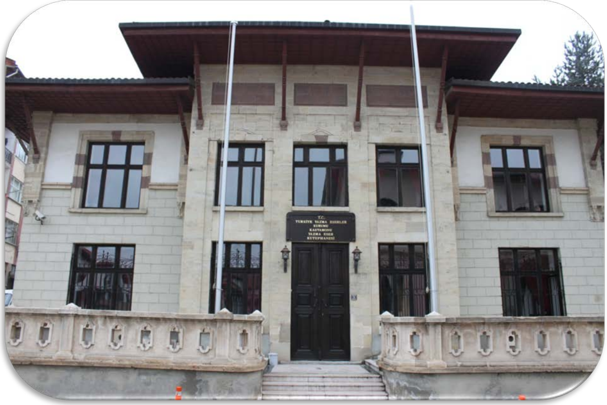
Kastamonu Yazma Eser Kütüphanesi