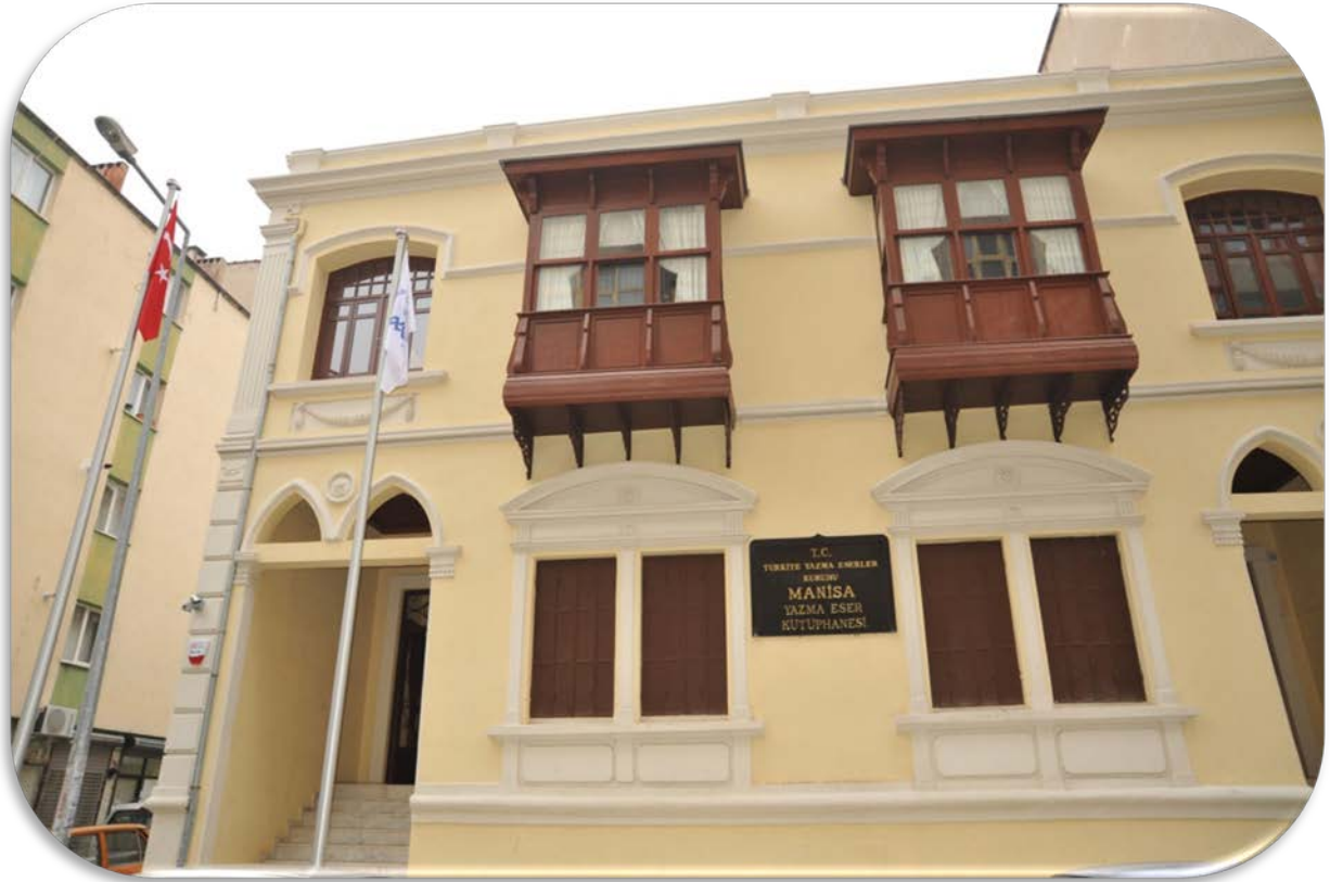
Manisa Yazma Eser Kütüphanesi